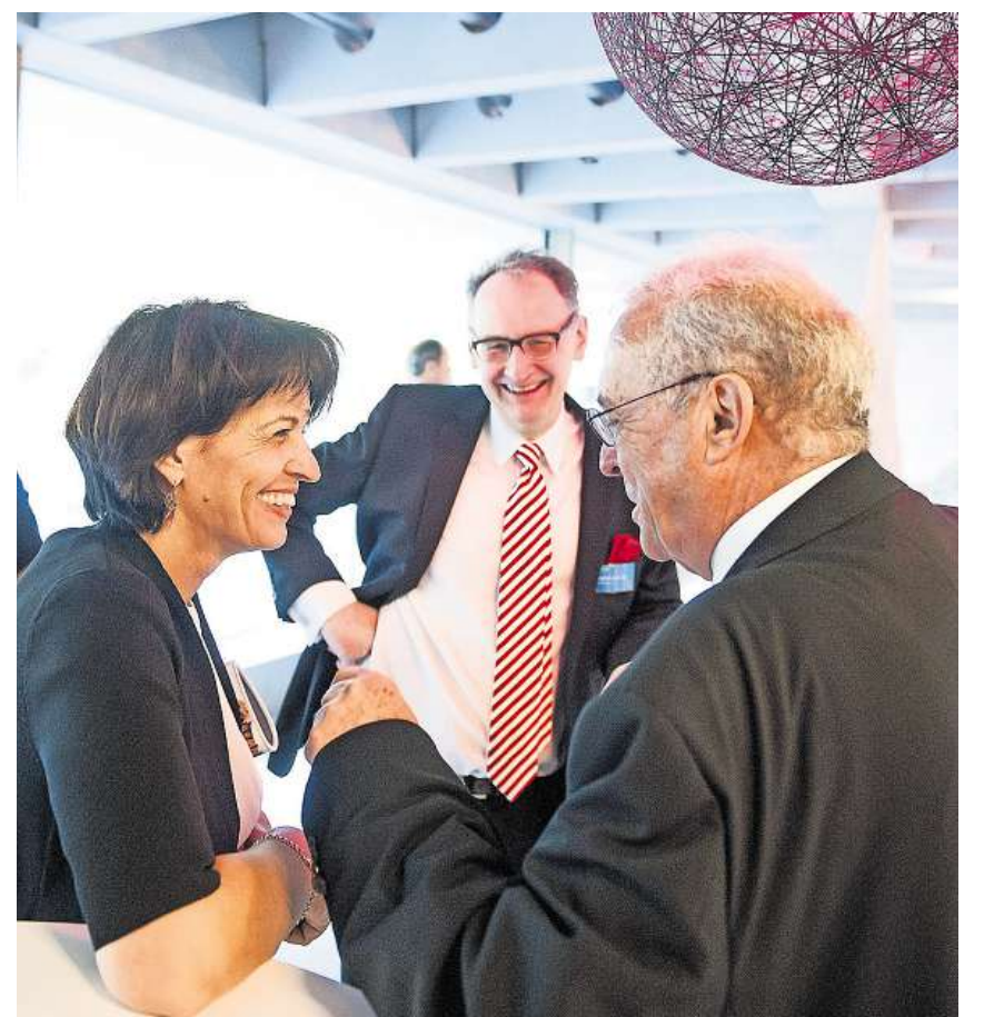
Aus der ganzen Schweiz und diversen Branchen: 120 Persönlichkeiten gaben sich zur offiziellen Eröffnung des Medienhauses der Samedia die Ehre.